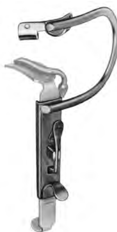
ZA-003-248 / ZA-003-254