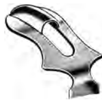
ZA-004-578 bis / to ZA-004-580