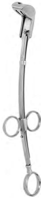
LD-020-020 bis / to LD-020-023