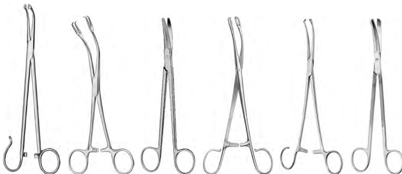
ZA-004-594 / ZA-004-595