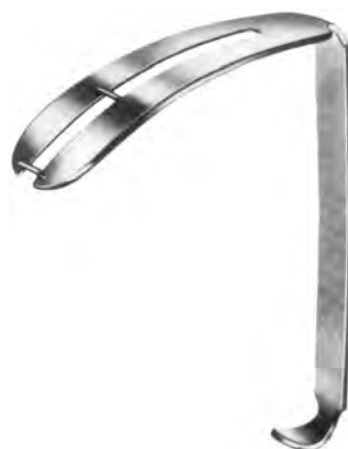
ZA-004-581 bis / to ZA-004-585