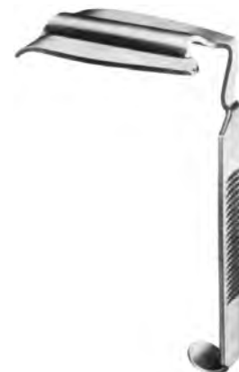
ZA-004-586 bis / to ZA-004-593