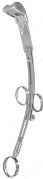
LD-020-025 bis / to LD-020-027