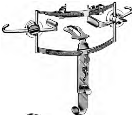
ZA-004-576 / ZA-004-577