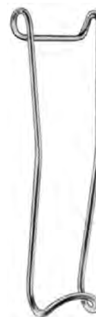
ZA-003-256 bis / to ZA-003-258