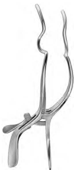
ZA-003-240 / ZA-003-241