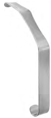
LD-030-003 bis / to LD-030-005