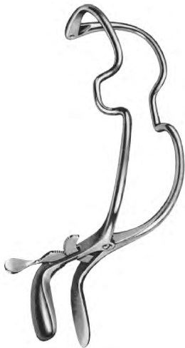
ZA-004-572 bis / to ZA-004-575