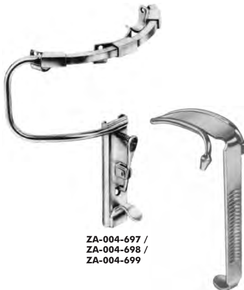
ZA-004-697 / ZA-004-698 / ZA-004-699